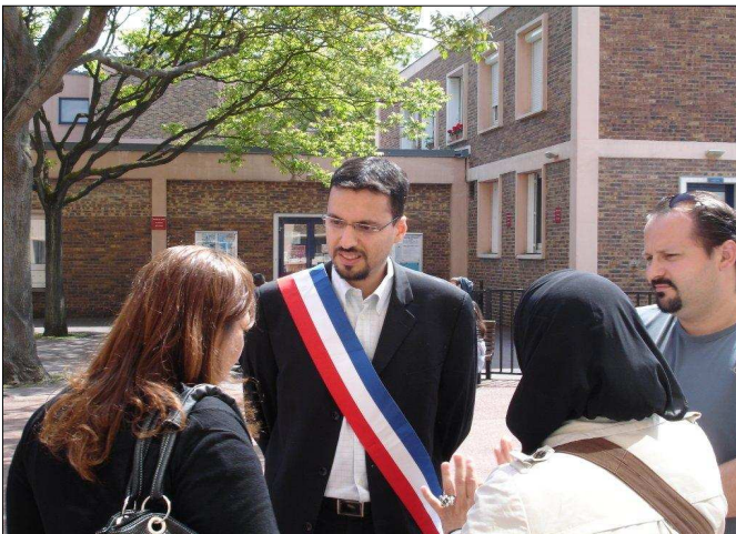
Depuis 2008, 7 permanences tenues sur le quartier du parc (nord et sud) pour 43 personnes reçues. 3 permanences tenues au Petit Nanterre pour 15 personnes reçues.

Et puis, j'ai voulu faire davantage, m'investir autrement. C'est ainsi que je suis devenue en mars 2008 conseillère municipale. A ce titre, j'agis au quotidien sur le quartier du Parc où je représente notamment la ville à l'école maternelle et élémentaire Néruda, à l'école de danse de l'opéra de Paris et au conseil d'administration du collège Paul Eluard.